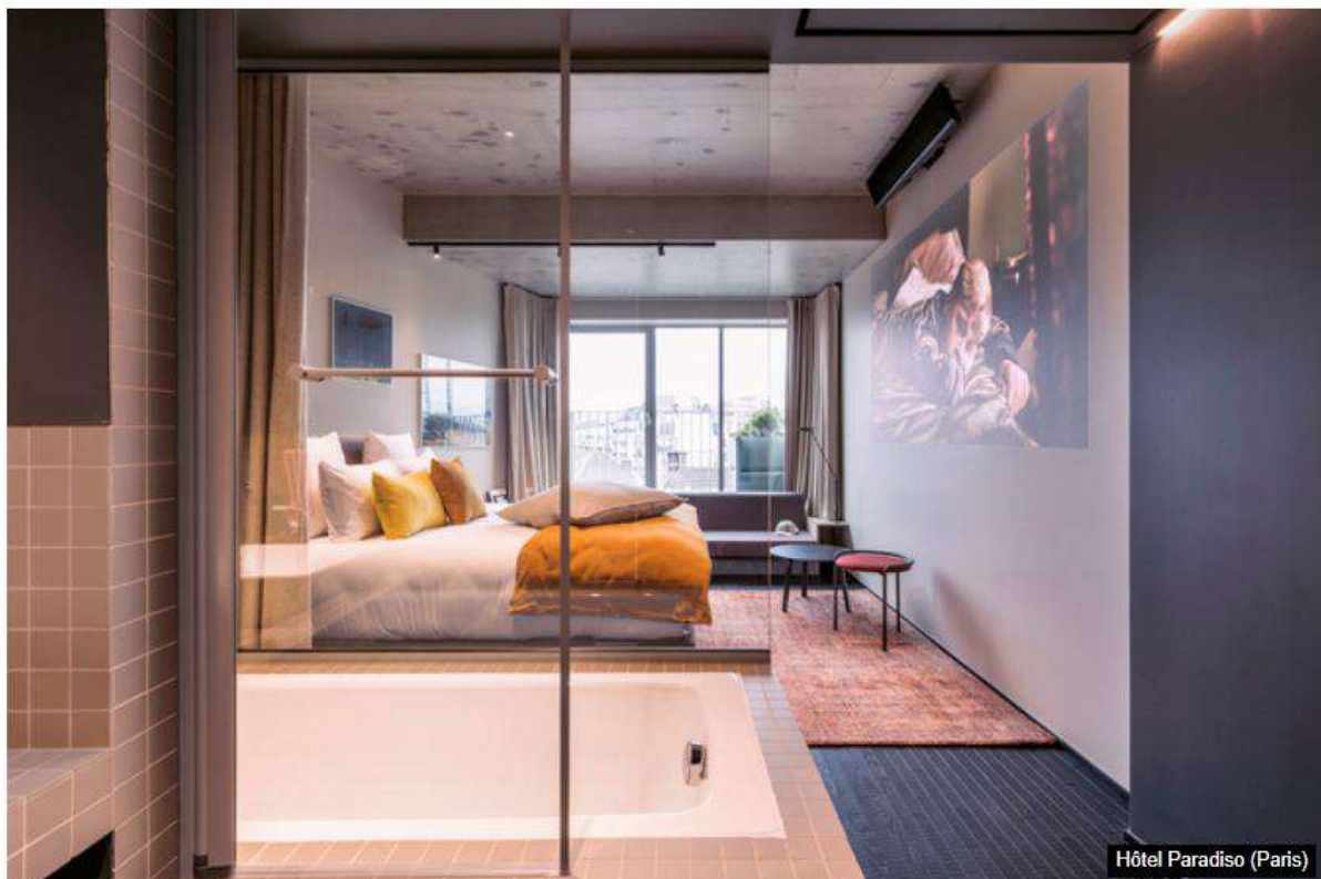
Hôtel Paradiso (Paris)